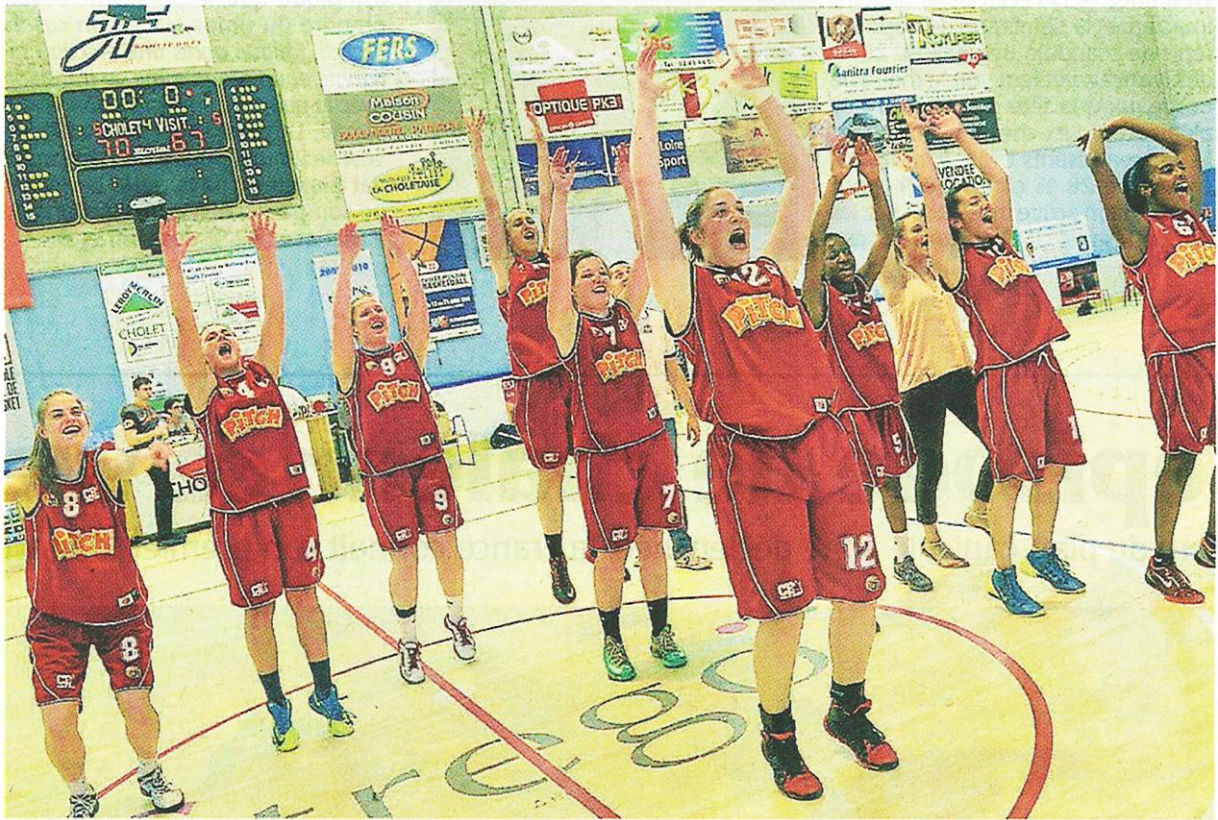
Cholet, salle Darmaillacq, hier. Face à leur public, les Choletaises ont pu laisser exploser leur joie après un match qui s'est joué dans les dernières secondes.

Grâce à un panier quasiment au buzzer de Baranger, Cholet s'est adjugé, hier soir, la Coupe des Pays de la Loire face à l'UF Angers.